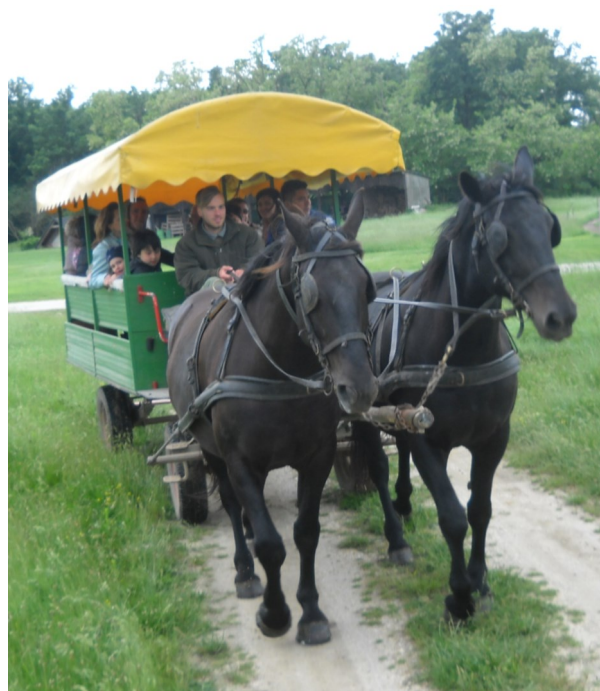
Esőben is jól esik a szekerezés Göbös-majorban