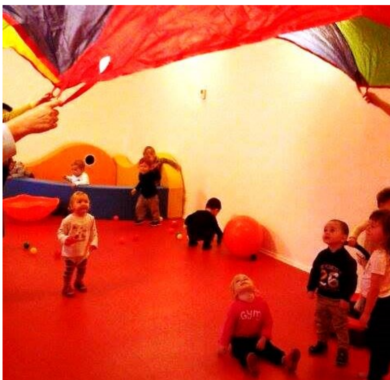
A bölcsődés kisgyermek az újonnan kialakított tornaszobában élvezik a mozgás örömét

eközben észrevétlenül alakulnak a finommotorikus képességeik, a figyelmük, a koncentráció képességük és a szépérzékük. Napi szinten hangsúlyosan jelen van nálunk a zene, a magyar népi mondókázás és a mese. Mindamelllett, hogy ezek nagy élményt jelentenek a gyerekeknek, rendkívül jó hatással vannak lelki, érzelmi, értelmi, anyanyelvi fejlődésükre. Ezek mellett a legkisebbek számára talán a legfontosabb a szabad mozgás. Sokat vagyunk kint a szabad levegőn, ahol futkározhatnak, ugrándozhatnak. Az udvarunkat a kerti játékok és homokozó mellett kerti padokkal és asztallal bővítettük, így lehetőség van arra, hogy jó időben a tízórait is már a kertben kapják meg a gyerekek. Tavasszal a gyerekekkel közösen veteményeztünk és örömmel figyeltük a növények, virágok növekedését. Hamarosan tornaszobával is gazdagodik napközink, ami a