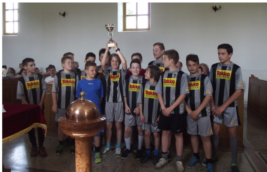
Fent jobbra: A győztes felsős csapat focikupa eredményhirdetésén