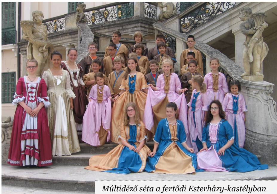
Múltidéző séta a fertői Esterházy-kastélyban

Reggeli áhítat, délelőtti foglalkozás, kézműveskedés és sok játék alkotta az idei napközis tábor napjainak rendjét, amelynek során Pál apostol életének történeteivel ismerkedhettünk meg. A nyár szinte görög világgá változott körülöttünk. Megtanultunk a görög abc betűivel írni és nyomdáztunk velük. Athéni olimpiát