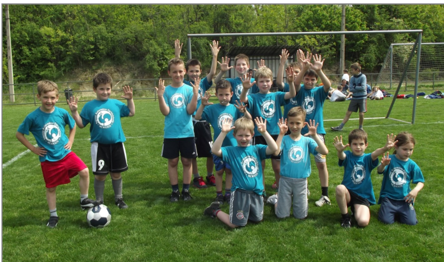
Lent balra: Az alsós korosztály játékosai 9 nullra győztek az egyik mérkőzésen!

„...hiszen azért fáradunk és küzdünk, mert az élő Istenben reménykedünk, aki üdvözítője minden embernek, de leginkább a hívőknek.”