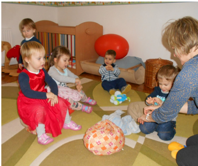
Mondókás, éneklős foglalkozáson az egyik csoportban

Csoportjaink mindennapi élete előre megtervezett program alapján zajlik. A kicsik talán legkedveltebb tevékenysége a sok szabadidős játék mellett, az éneklés, a táncolás, a kézműves foglalkozás volt. A gyerekek hatalmas alkotókedvvel rendelkeznek, mindent szívesen kipróbálnak, legyen az festés, gyurmázás, ragasztás, gyűrés, tépés... Alkotásaik szépek, színesek, sok örömet okoznak nekik és