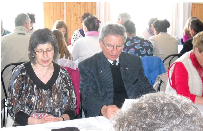
Az úrvacsorázó és éneklő gyülekezet