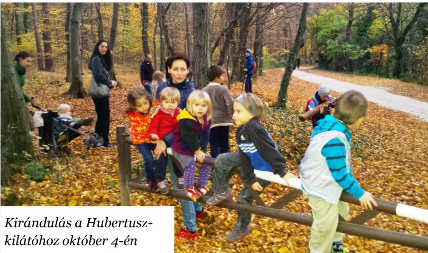
Kirándulás a Hubertusz-kilátóhoz október 4-én