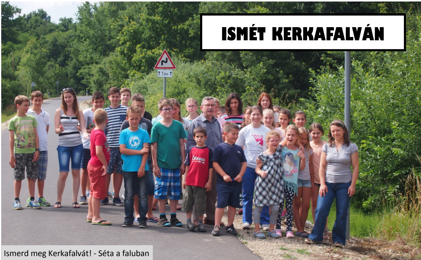
Ismerd meg Kerkafalvát! - Séta a faluban

Idei nyári táborunkat június 28-július 4. között tartottuk Kerkafalván, 34 hittanos gyermek és nyolc felnőtt kísérő részvételével.