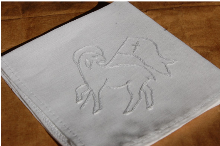
A keresztelő kendőkön a halálon győztes Jézus Krisztus szimbóluma: a „zászlós Bárány”

ségben szenvedőknek. Minden évben gyűjtünk ágyneműt és pizsamát a soproni Tómalom utcai fogyatékkal élő gyermekek számára. Az adventi gyűjtés során mintegy 400 ezer Forint értékű adományt tudunk becsomagolni és továbbítani. Hálás köszönetünket fejezzük ki minden jókedvű adakozónknak.