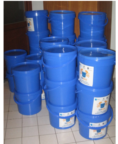
A megtelt kék vödörök

Misi Pakk programunk, amelynek során kisgyermeket ajándékozunk meg egy cipős doboznyi nekik szóló játékkal és édességgel. Ehhez társult az idén az ún. "Kék Vödör" akciónk. Egy műanyag vödörnyi tartós élelmiszert készítünk el így harminc háttaron túli családnak, amelyet a Magyar Református Szeretetszolgálaton keresztül juttatunk el a szük-